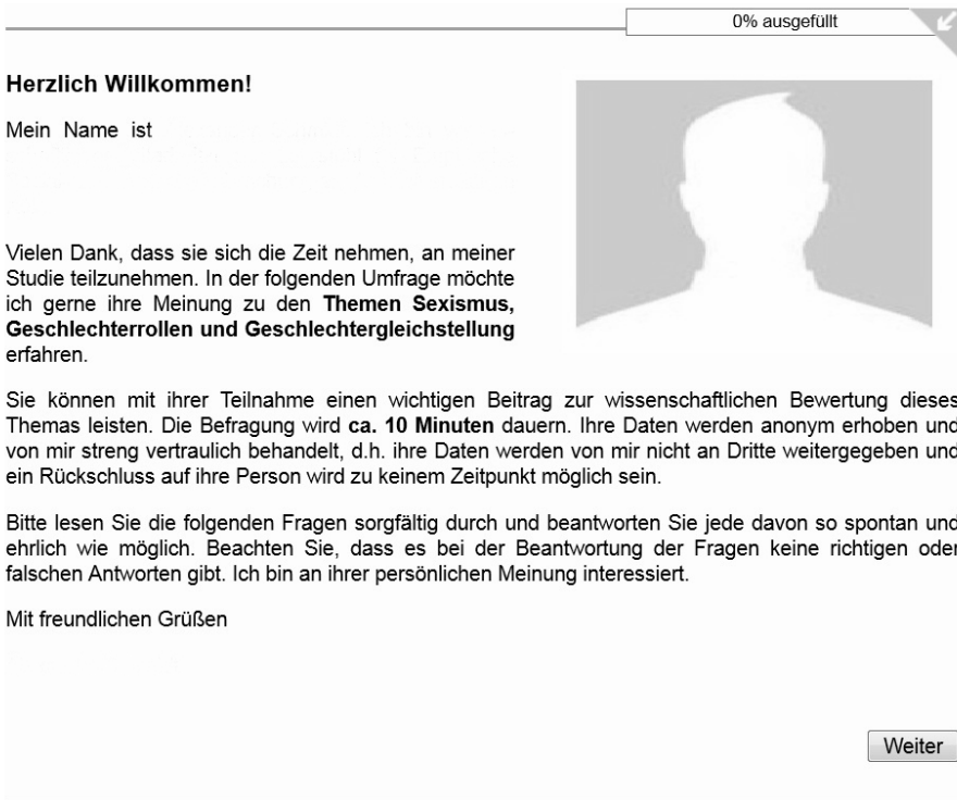
Abbildung 2 Antwortaufforderung in der Experimentalgruppe Mann (anonymisiert)